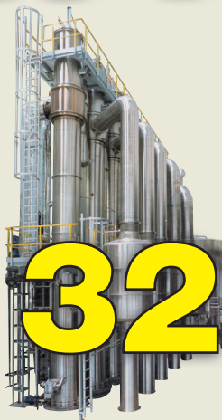
Verdampfung und Aromarückgewinnung