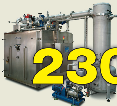
Trocknungsschrank für Vakuum- und Gefriertrocknung