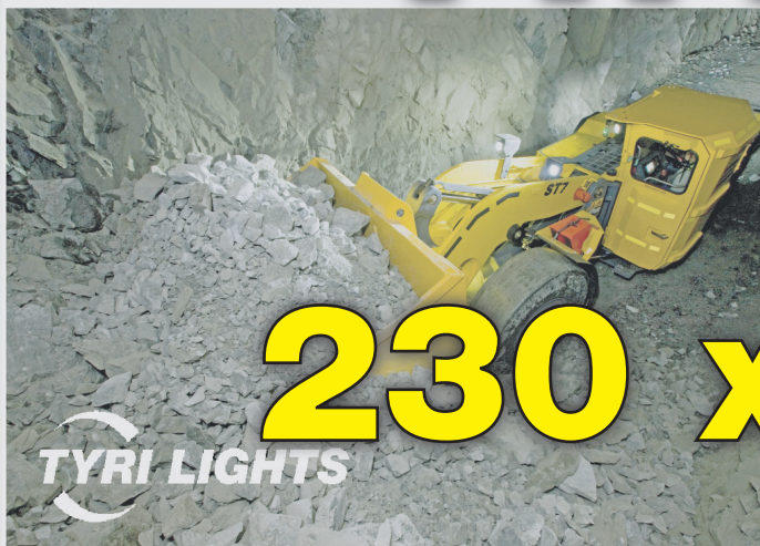
Eine gute Arbeitsumwelt verlangt eine gute Ausleuchtung: TYRI Lights setzt auf der bauma den Schwerpunkt auf „Gute Ausleuchtung für Baumaschinen im Arbeitsbereich bei hoher Produktivität und Sicherheit“.